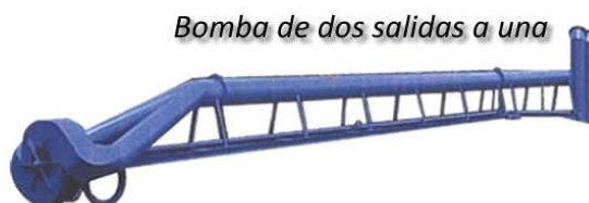
Bomba de dos salidas a una