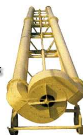
Bomba de dos salidas